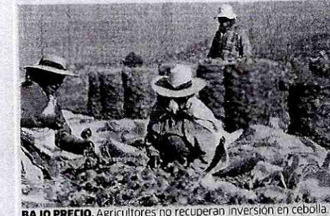
BAJO PRECIO. Agricultores no recuperan inversión en cebolla.