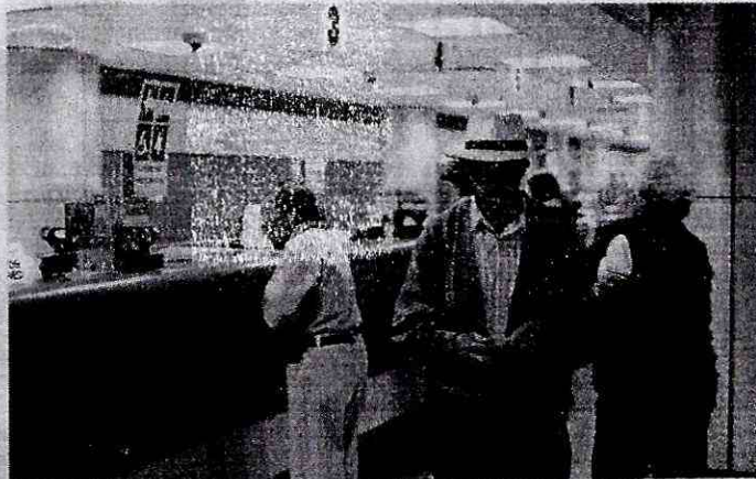
A CUENTA. Docentes beneficiados recibirán depósitos mediante su cuenta bancaria.

Educación aún hace los cálculos del número de docentes que serán beneficiados. En base a su proyección 3 mil 110 profesores activos y más de tres mil cesantes serían beneficiados. No obstante, está sujeto al reajuste.