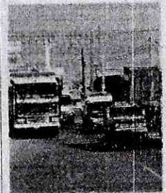
Cambian de sentido a vía.

El cambio a un solo sentido se ejecutará en horas de la tarde. La Policía de Carreteras y Covisar ya trabajan para definir los horarios y coordinar con las empresas de transporte de pasajeros de servicio interprovincial y de carga pesada. Sin embargo, el ingreso a la ciudad será el calvario de los conductores y veraneantes, ya que la Variante de Uchumayo seguirá cerrada.