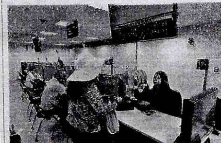
SUNAT. Aplica norma que mejora el control a contribuyentes.

Arequipa. De acuerdo con el cronograma de masificación de comprobantes de pago, la Superintendencia Nacional de Aduanas y de Administración Tributaria (Sunat) informó que todas las empresas consideradas como Principales Contribuyentes deben emitir desde ayer, 1 de enero, facturas electrónicas.