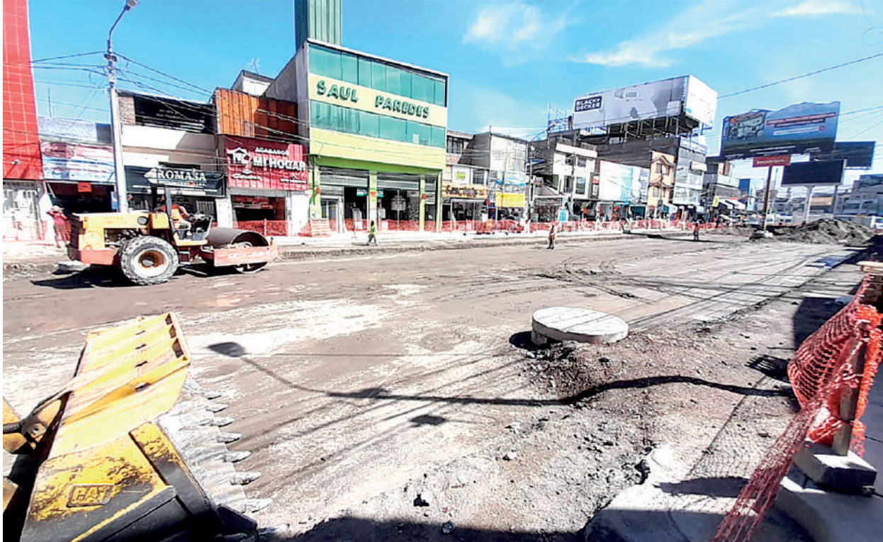
• OBRAS SIN MAYOR trascendencia y registras significativo atraso.

Videnza Consultores elaboró el Índice Local de Eficiencia en la Inversión Pública (ILEI) para el caso de las provincias se evaluó a 194, entre ellas la MPA, por ejemplo, para el ítem de evaluación Retraso de Proyectos, que no es otra cosa que el incumplimiento de entrega de una obra en el plazo estipulado. La MPA ocupa el puesto 181 de un universo de 194 municipios provinciales analizados. El retraso en la entrega es de aproximadamen-