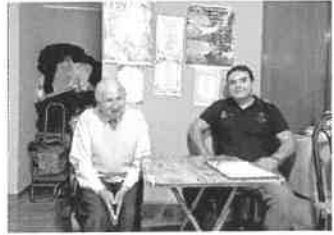
• ESCRITOR RECIBE apoyo de familiares y amigos.

piraciones del Corazón" aún no está definida. Al escritor le gustaría que lo muestre a él en su querida calle Mercaderes, donde hace más de 10 años comenzó a vender sus poemas y que hoy lamentablemente ya no puede visitar con frecuencia debido a su debilitada salud. Aunque cabe aclarar que su sueño empezó mucho tiempo atrás. Después de tantos años