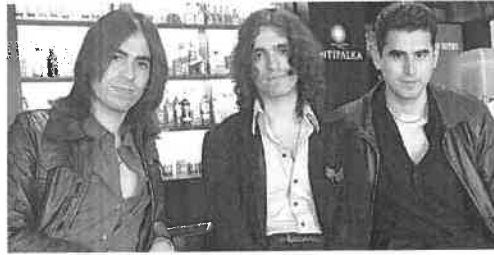
• THE BEATLES de «Yo Soy» se presentará en Arequipa.