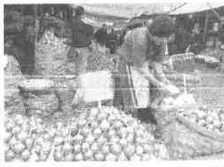
AGRICULTORES no recuperarán inversión por bajo costo de venta de la cebolla.

Además, el presidente de esta Junta de Usuarios informó que la cosecha de cebolla se extenderá hasta agosto.